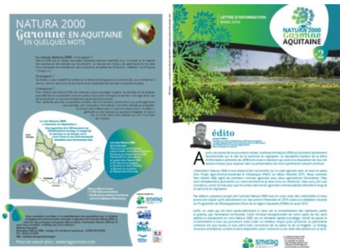
Figure 3 : Aperçu de la lettre d'information n° 2

La première lettre d'information avait été diffusée en début d'année 2014 suite à la validation du DOCOB. Cette deuxième lettre présente les différents leviers d'actions mobilisables dans le cadre de Natura 2000 avec un zoom sur les contrats MAEC (interview d'une agricultrice ayant souscrite à une mesure MAEC en 2015). Elle sera distribuée à l'ensemble des membres du COPIL et aux collectivités du périmètre. Elle sera également un support de communication auprès du public lors des manifestations de la troisième année d'animation. Un exemplaire de cette lettre d'information est joint à ce compte rendu.