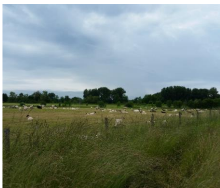
Figure 1 : Contractualisation sur l'île Raymond (33)

Sur le périmètre Natura 2000, un Projet Agro-Environnemental et Climatique (P.A.E.C.) a été rédigé puis validé en début d'année 2015. L'objectif de ce contrat est de soutenir financièrement les agriculteurs qui souhaitent mettre en place des pratiques respectueuses de l'environnement. Le Comité de pilotage Natura 2000 organisé le 22 janvier 2015 a permis de valider les éléments constitutifs du dossier dont les mesures proposées aux agriculteurs. Ainsi 13 Mesures Agro-environnementales et Climatiques (M.A.E.C.) peuvent être contractualisées. Ces mesures peuvent être engagées sur les îlots PAC qui ont a minima une parcelle touchant le périmètre Natura 2000.