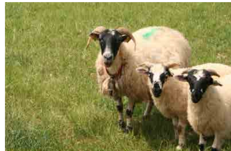
Le pastoralisme sur l'île Raymond, à Paillet en Gironde, un mode de gestion durable soutenu par Natura 2000.

Par exemple, lutter contre l'embroussaillage d'une prairie grâce au pâturage, entretenir la forêt alluviale ou supprimer l'utilisation de pesticides sont des actions simples et leur utilité est bel et bien démontrée pour la préservation des espèces végétales et animales. Ainsi sur le site de la Garonne en Aquitaine 14 mesures sont proposées aux agriculteurs sur différents types de milieux et de cultures.