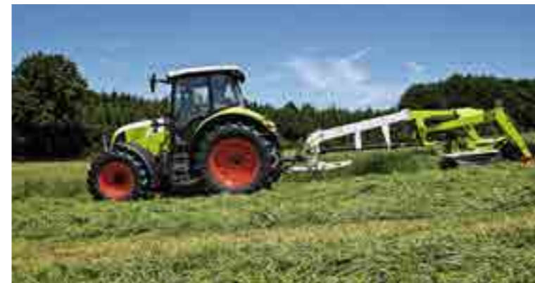
Le fauchage mécanique permet d'entretenir les prairies et d'éviter la «fermeture» et l'appauvrissement de la biodiversité des milieux naturels.