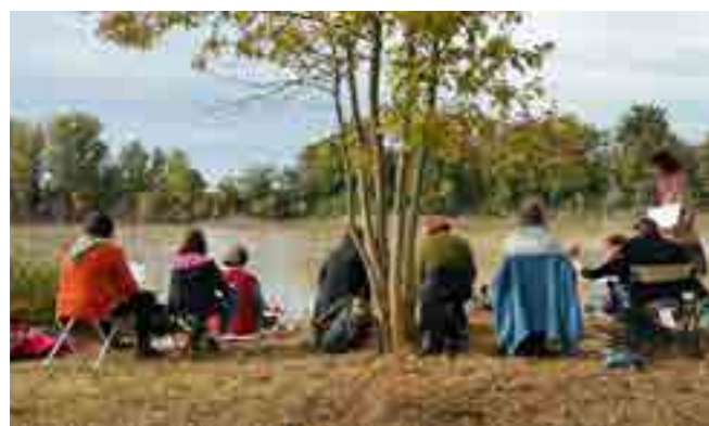
À la découverte de la biodiversité exceptionnelle des bords de Garonne.

La sensibilisation fait pleinement partie de la démarche Natura 2000. Très présent sur le territoire, l'animateur du Sméag qui est la structure porteuse, initie et soutient des actions auprès des habitants du territoire. Expositions, visites commentées, interventions dans les classes... sont ainsi organisées régulièrement à la demande des acteurs locaux (collectivités, associations,...). Pour protéger le site, il est essentiel d'impliquer les personnes qui y vivent et de leur montrer à quel point il est exceptionnel et fragile.