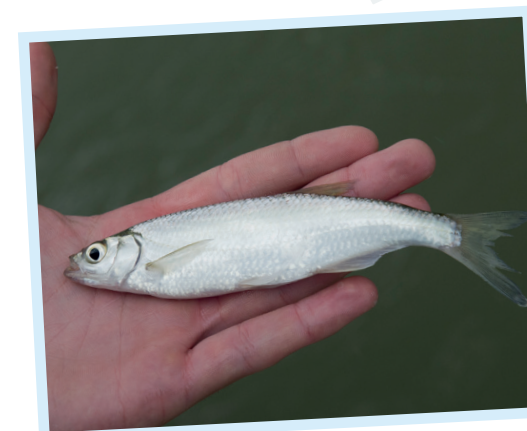
Suivi des aloses juvéniles (ou alosons) dans la Garonne en Lot-et-Garonne

La loutre d'Europe utilise le corridor garonnais pour se déplacer sur tout le bassin. Cette extension du périmètre est cohérente avec les enjeux de conservation du site Natura 2000. La mise en oeuvre d'actions comme la valorisation de ripisylves permettant le maintien et le développement de la Trame Verte. La Garonne est favorable à de nombreuses espèces (mammifères, chiroptères...).